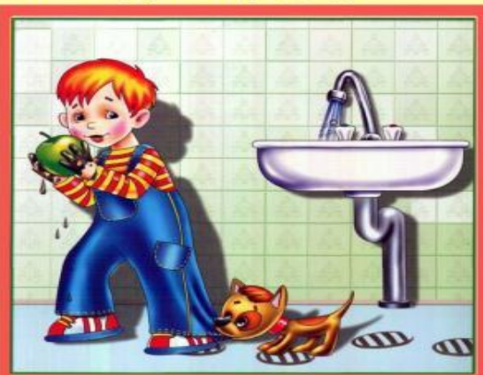
Мойте руки перед едой